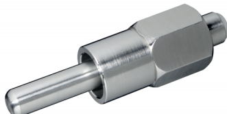
10092-13 a 200 Humedecedora 1/2" para cerdas, caudal agua max 8 ltr/min., con rosca hembra 1/2"