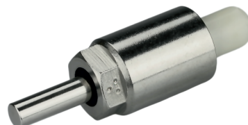
10092-5* a 50 Humedecedora 1/2" para lechones, destete y engorde, con rosca hembra 1/2"