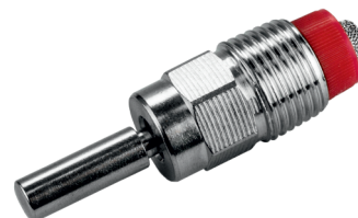
10092-12* a 50 Humedecedora 1/2" para lechones y destete, con perna liso