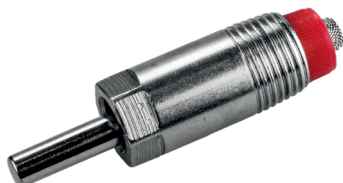
10092-10* a 50 Humedecedora 1/2" para destete y engorde, incl. orificio de 4 mm