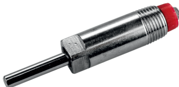
10092-11* a 50 Humedecedora 1/2" para destete y engorde, incl. orificio de 4 mm