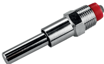
10092-3* a 50 Humedecedora 1/2" para destete y engorde, largo 90 mm