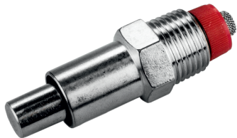
10092-2* a 50 Humedecedora 1/2" para engorde y cerdas