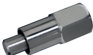
10092-38 a 25 Humedecedora 3/8" para destete y engorde, con rosca hembra 3/8"